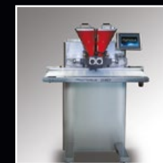
OSD-0 mm 960x500x1450